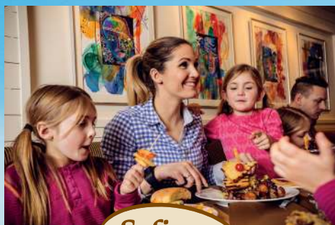
Sofias Café & Bar

Stor barnebuffet serveres til middag alle dager i restauranten